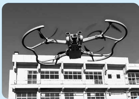
情報戦略課によるドローン講習会 (旧安中高校)