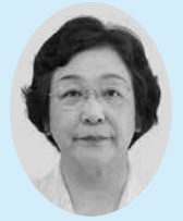
こやま よう葉 しゃ者 (公明党) む武