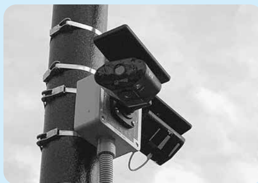
設置が望まれる防犯カメラ (磯部温泉街)

答 利用者の多い箇所では、平成29年度より5月から10月の間、回収回数を増やし、令和元年度より1台当たりの回収量も増量しています。