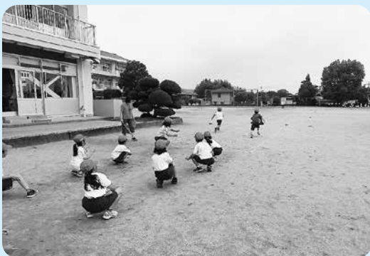
安中小1年生の体育の授業

答 学級編成の標準は「公立義務教育諸学校の学級編成及び教職員定数の標準に関する法律」により定められており、国の教員増員支援の動向を注視します。その他、子育て支援拠点事業と災害対策について質問しました。