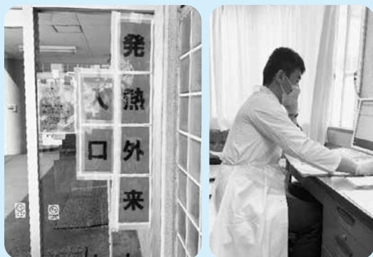
碓氷病院に設置された発熱外来

答 災害時や感染症の緊急時でも、児童生徒の学びの充実を図るために、1人1台の端末機器の配備や通信環境の整備を進めます。