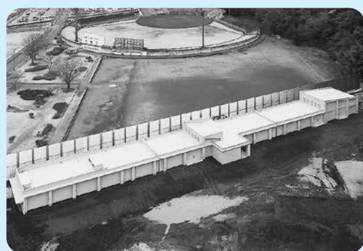
群馬県クレー射撃場に新たに併設されたライフル射撃場