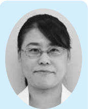
ながしま ようこ 長嶋 陽子 (公明党)