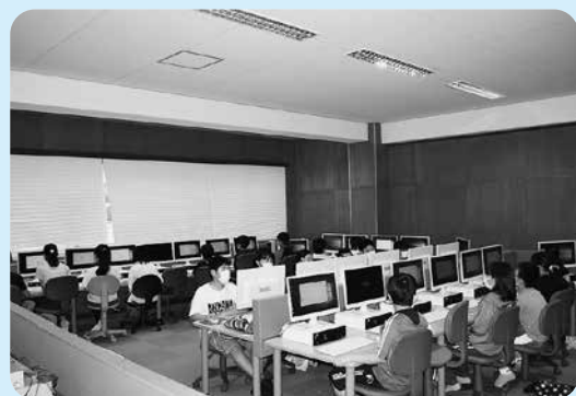
小学校のパソコンを使った授業