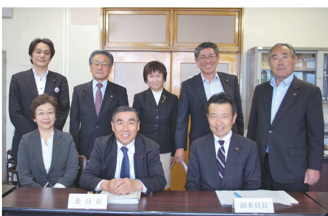
安中市議会報編集委員

新しいメンバーで編集委員会がスタートしました 皆様に読みやすく親しみのある紙面作りを目指していきます。