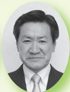
うえはら ふじお 上原富士雄 (公明党)