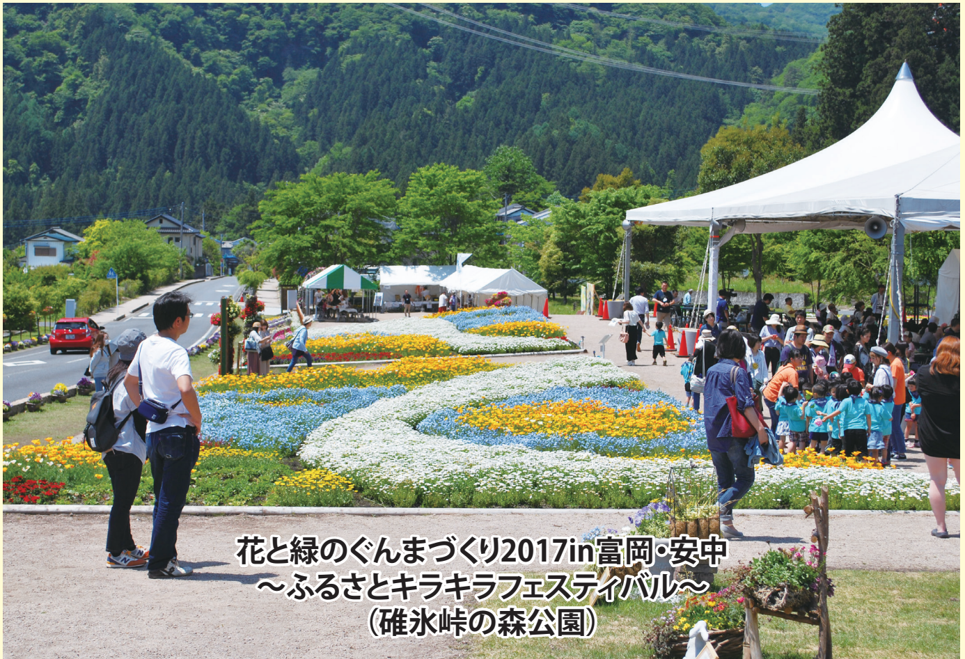
花と緑のぐんまづくり2017in富岡・安中 ～ふるさとキラキラフェスティバル～ (碓氷峠の森公園)

◆発行日 平成29年 6月27日 ◆発行 安中市議会 ◆編集 安中市議会報編集委員会 ◆印刷 碓氷印刷