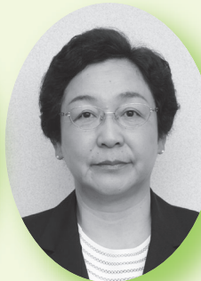
むしゃ ようこ 武者葉子 (公明党)