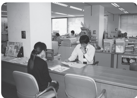
空き家相談窓口 (地域創造課)