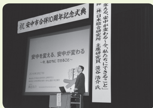
合併10周年記念講演