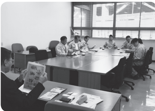
炭鉱さるくについて学ぶ(長崎市)

池島炭鉱は、平成十三年に閉山しそのままになっていましたが、近代化遺産として、世界遺産登録を目指し、軍艦島等と共に、観光