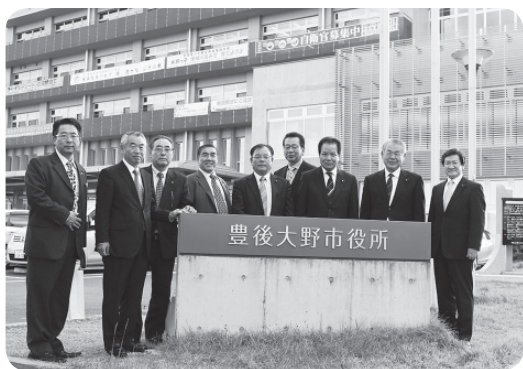
豊後大野っ子市議会について

市議会の模擬体験を通じて、日頃の疑問や地域の課題について、自ら考え、自らの言葉で市長等と話し合うことにより、市政やまちづくりに対する関心を高め、また教育の一環として、行政や議会の仕組みについて理解を深めるためです。教育委員会との打ち合わせやリハーサルを行い、本番を迎え無事に終了できたとのこと。大変興味深い取り組みであり、本市も参考にして、子ども議会開催に向けて取り組んでいきます。