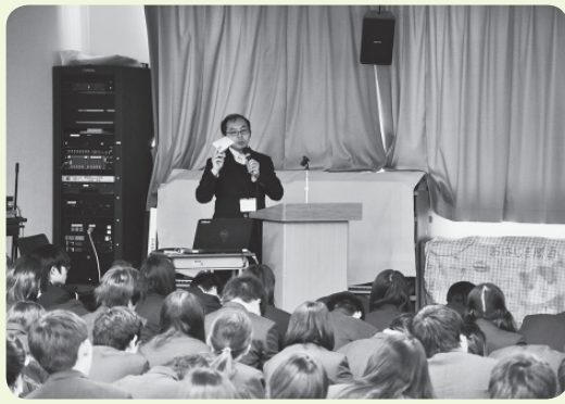
選挙についての出前講座

答 十五名で構成し七月から現在まで五回開催。内容は現状認識・救急患者受入れ体制・医師確保・職員の意識改革・現状での診察や入院・透析の対応策・民間病院との連携・経営改善で七項目に亘り病院改善の方針を決定。救急搬送は消化系五十九、呼吸器と脳疾患四十二、心疾患三十六と収容患者の約半数です。