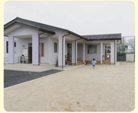
東横野学童クラブ