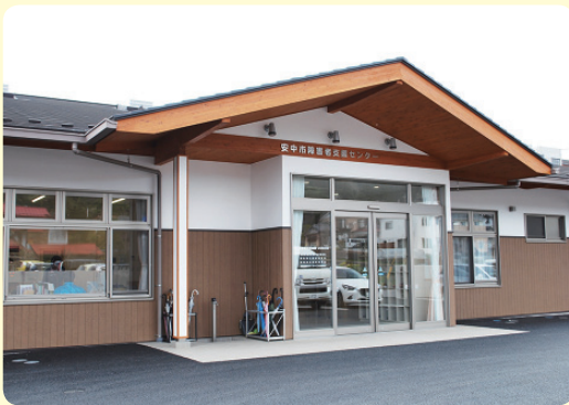
障害者支援センター COSMOS