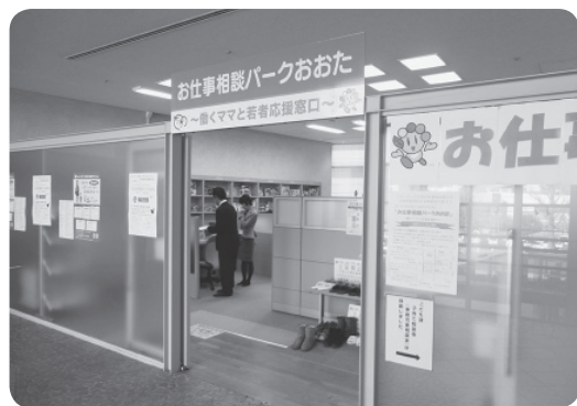
他市のお仕事相談パーク

答 全国二千七百六社に実施し、群馬県等に新設や移転を考えている企業が十九社ありました。