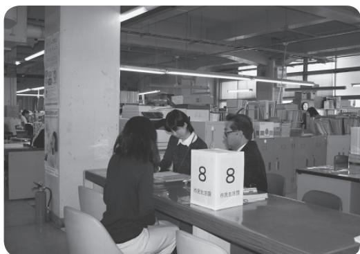
婚活相談窓口 (市民生活課)

問 今後必要と思う事業は。 答 もう一人生みたいと思える環境づくり、相談、情報提供、助言などの相談窓口を設置し充実に努めます。