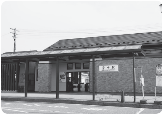
リニューアルされた安中駅

● 地方交付税の見直しについて ● がん検診推進事業補助金の減額要因について ● 児童福祉費補助金の減額要因について