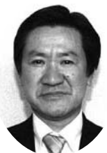
上原富士雄 (公明党)