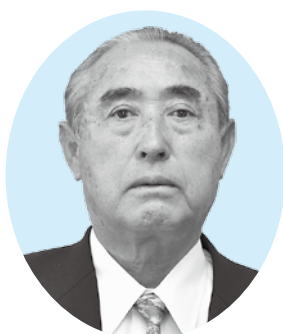
(18) やなぎさわよしやす 柳沢 吉保