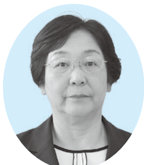
(6) むしゃ 武者 ようこ 葉子