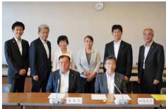
安中市議会報編集委員会委員

引き続き「読みやすい」「わかりやすい」議会だよりの作成に向け、リニューアルを進めていきます。