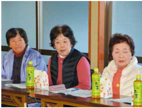
▲東横野6区で参加された皆さん

現在の、本市では6本の乗合バス路線(1本は事業者による自主運行路線)と2本の乗合タクシー路線を運行しています。公共交通は、これまで買い物や通院、通学といった生活に必要な不可欠な移動手段としての役割を担ってきましたが、今後も運転免許を返還した人などの増加によりバスやタクシーを必要とする機会がさらに増えることが予想されます。 本市では現在実施している乗合タクシー(午後・デマンド運行)の周知と利用促進を目的に、東横野6区と大谷地区の2つの地区の住民の皆さんにご協力をいただき、モニターツアーを実施しました。 今回のモニターツアーは、乗合タクシーが午後実施しているデマンド運行(※)の利用を想定して行いました。両地区とも実験のためあらかじめ決められた場所で乗り合わせ(実際の運行は、決められた路線上であれば自分で乗る場所を決められます)、それぞれの地区の近くにあるスーパーに買い物に行きました。約1時間の買い物と済ませたみなさんには各地区で乗合タクシーに関心のある人も交え、市長と公共交通について話し合ってもらいま