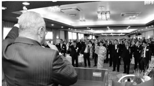
▲新年賀詞交歓会が行われ、参加者の皆さんは新年のあいさつを交わしていました。