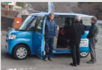
▲講習を受ける運転ボランティアの皆さん

公共交通に限らず、地域の皆さんの交流が深まり、つながりが作られるこのような取り組みが、今後ほかの地域にも広がることが期待されます。