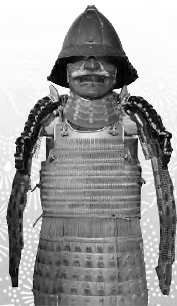
朱漆塗紺糸威切付小札二枚胴具足(赤備え)

日時 5月14日(日) 午後1時30分～3時30分 講師 大石泰史氏 (NHK大河ドラマ『おんな城主 直虎』時代考証担当者) 会場 ふるさと学習館市民ギャラリー 定員 50人(先着順) 受講料 100円(観覧料を含む) 申込方法 4月13日(木)午前8時30分から、ふるさと学習館の窓口、または電話でお申し込みください。(当日受付可)