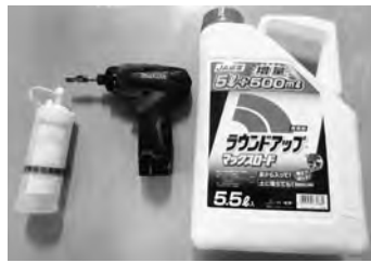
▲薬剤を注入する器具と薬剤

近年、竹林の生育面積の拡大とそれに伴う森林の荒廃が問題となりつつあります。そのほかにも住宅地や農地では地下茎による隣地への侵入や日照不足、積雪時の倒伏による道路通行への支障などさまざまな環境問題が生じております。