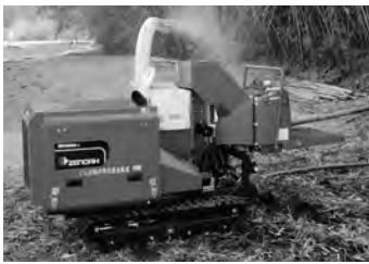
▲貸与する竹粉碎機