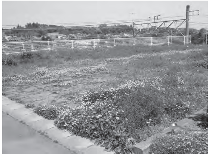
▲売却区分番号 29-3 の物件

市税の滞納処分として差し押さえた不動産を公売によって売却します。今回は、4件の不動産(土地)が公売対象で、売却代金は市税に充てられます。 本市では、例年11月に近隣市町村と合同で不動産公売を行っています。 今回は、本市単独での不動産公売を行います。 公売機会を増やすことで、より多くの入札・売却と税収確保を目指します。 どなたでも参加ができますので、ぜひご参加ください。詳細はホームページか公売広報でご確認ください。