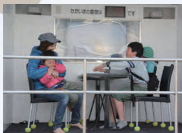
起震車による地震体験