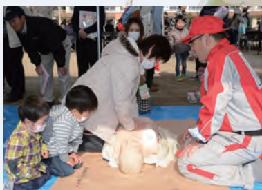
AED・心肺蘇生法体験

また、同訓練と平行して、起震車や自然災害体験車をはじめとした各種の体験ブースと、災害時に活用する車両や資機材などの展示ブースを設置し、多くの来場者に実際に防災を「見て」「触れて」「体験」していただきました。