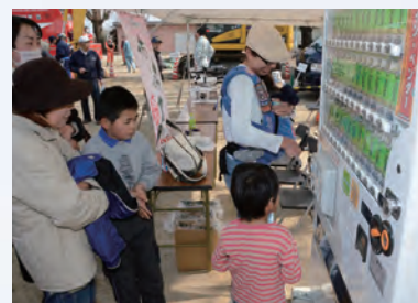
災害対応自動販売機体験