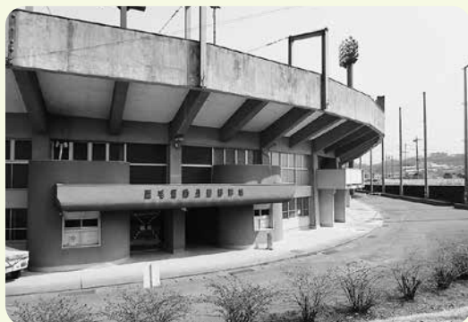
改修が待たれる西毛運動公園野球場