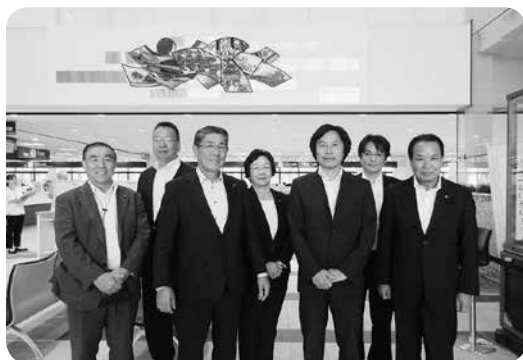
防災対策等について（半田市）

当市も、今後発生するであろう廃校や、不要になった市有施設の有効活用は必須であり、官民を上げての議論を望むとともに、研修視察などにおいて担当部署からの参加を含め意識を共有し、政策を立案できる人材の育成に取り組む必要があると痛感し、研修を終えました。