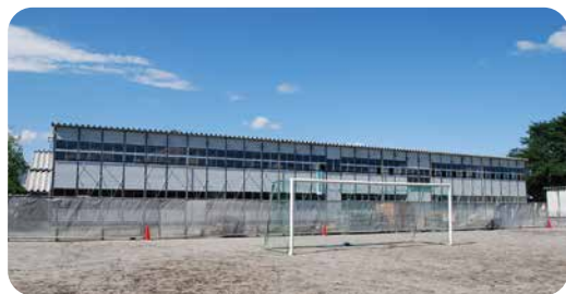
松井田南中仮設校舎

○安中市立松井田小学校 校舎耐震補強及び大規模改造建築工事請負契約締結について ○安中市立第一中学校校舎耐震補強及び大規模