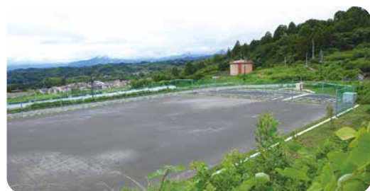
みのが丘北側広場