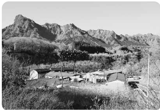
日本で唯一通年稼働している碓氷製糸工場

答 故人をしのぶのに相応しい景観を有する場所である、周辺道路の整備が行われており車での来訪に適している、住宅街から距離があり周辺の生活環境との調和が見込まれる、既存の施設を利用することで建設費用を抑えられること等を考慮しました。