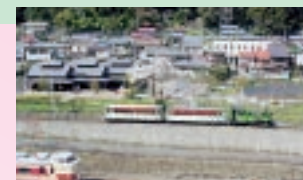
特急「あさま号」と園内を一周する「あぶとくん」

文化むらから途中まではアプトの道の横を峠のトロッコ列車が走っています。トロッコ列車の運行は、基本的に(土・日と祝日)ですが、臨時運行もあります。詳細はお問い合わせください。