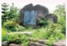
1号トンネルの手前にある北原白秋の歌碑

関所の西門は徳川幕府、東門は安中藩が管轄した、国境の関所跡。箱根の関所と並ぶ、日本三大関所跡の一つです。