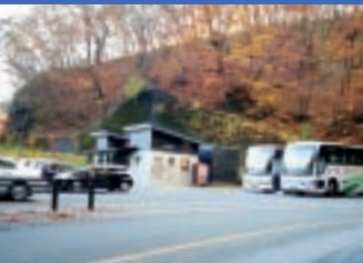
めがね橋無料駐車場

めがね橋 駐車場・トイレ有 芸術的で多くの人を魅了する、200万8000個のレンガで造られている日本最大の4連アーチ式鉄道橋。長さは91m、高さ31m。明治25年に完成した碓氷線のシンボル。駐車場、トイレは、橋を下り遊歩道を300m行くとあります。