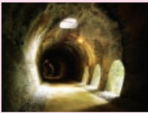
排煙口のある6号トンネル内部