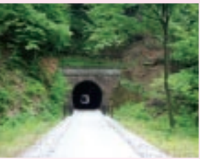
手前9号、その奥に8号トンネル

熊ノ平は信越本線が通わなくなり、今はアプトの道の折返しポイントとして生まれ変わりました。当初単線であった期間、横川～軽井沢間で唯一の平地地であった熊ノ平駅では、上下線の列車が待ち合わせてすれ違いをしていました。この頃の熊ノ平駅は、行楽の季節、乗降客で賑わっていました。そして信越本線が複線化すると、熊ノ平駅は、変電所の機能を残して、駅としての機能は必要とされなくなりました。