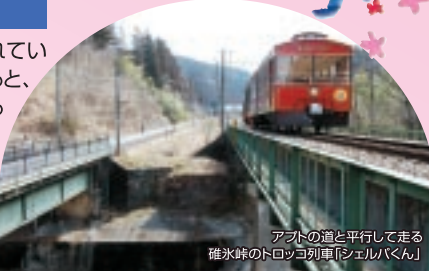
アプトの道と平行して走る碓氷峠のトロッコ列車「シェルパくん」

鉄道の歴史と列車が一同に集められているテーマパーク。入口のゲートを入ると、小さな子供から大人まで楽しめるSL「あぶとくん」が人気の的。本物の機関車を運転体験できるコースやズラリ展示された歴史的名車には、見て、触れることもできます。