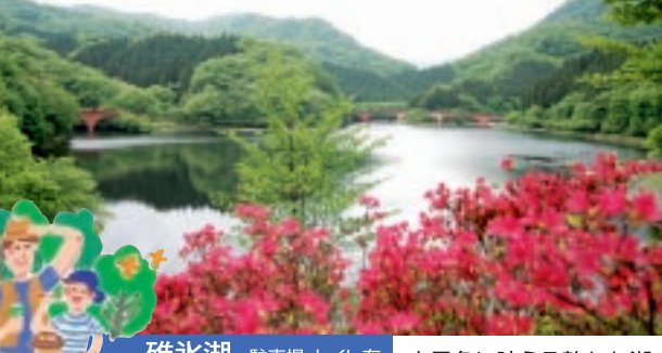
碓氷湖 駐車場・トイレ有 山景色に映える静かな湖。

見どころいっぱいの碓氷峠を巡る、遊歩道アプトの道をゆっくりと散策してみませんか。