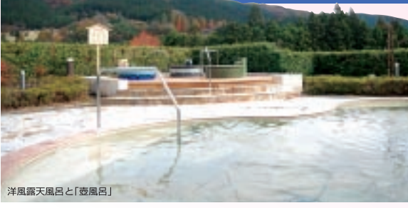
洋風露天風呂と「壺風呂」

お風呂は2階に和風・洋風大浴場(サウナ付)、露天風呂2カ所。風呂付休憩個室(要予約)も2室あります。アプトの道から直結した1階は入館無料。レストラン、売店、ロビー等をご利用いただけます。周辺観光の起点としても、ご活用ください。