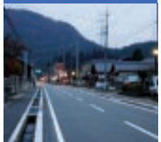
向こう正面が剱石山です。