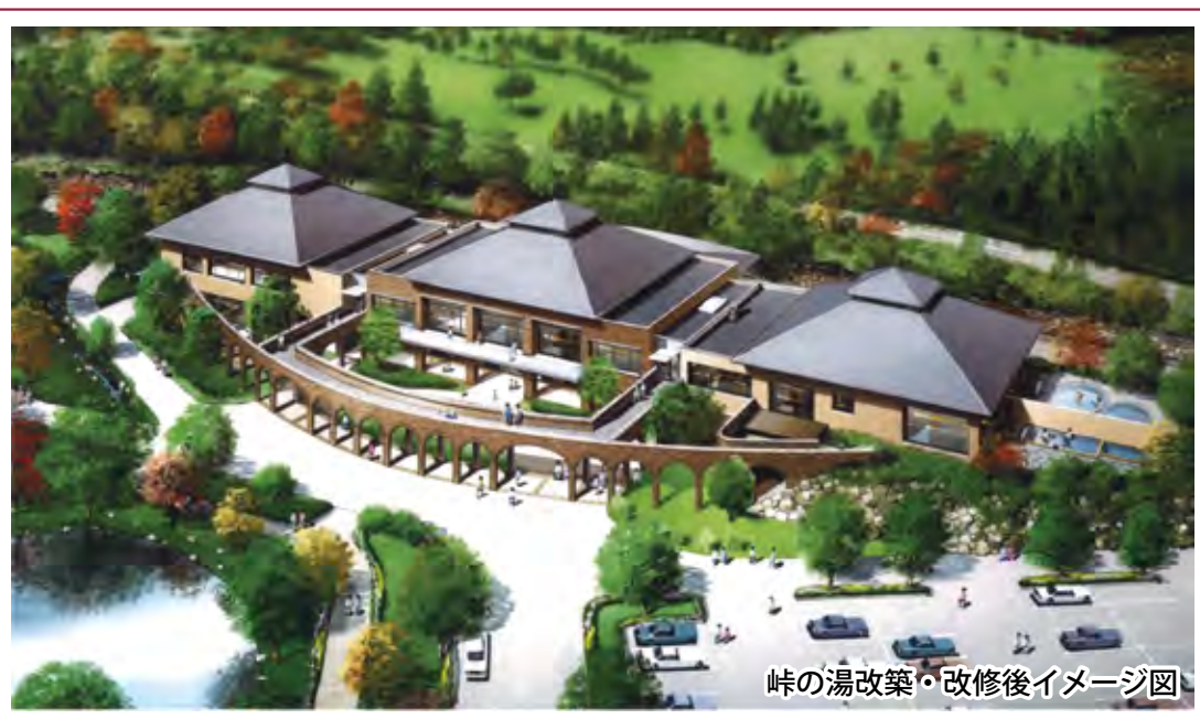
峠の湯改築・改修後イメージ図

平成25年7月の火災により休館中である、碓氷峠の森公園交流館「峠の湯」の改築・改修工事が始まりましました。以前の吹き抜け部分を床張りに、中央棟バルコニー部分を室内空間とすることで増床を図るなど、館内レイアウトも大幅に変更することになりました。