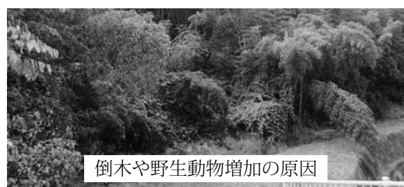
倒木や野生動物増加の原因