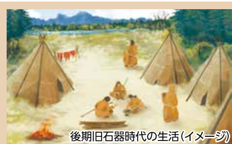
後期旧石器時代の生活(イメージ)

昭和61年（1986）の発掘調査で、遺跡からは槍の刃に使われる黒曜石の「ナイフ形石器」や、石器を作るために使う「敲石」と「台石」、皮をなめすために使う「削器」などが出土しました。これらは市内で出土した最古の遺物で、現在は「安中市指定重要文化財」に指定されています。