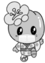
安中市マスコット キャラクター ころめちゃん