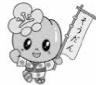
安中市マスコット キャラクター こうめちゃん