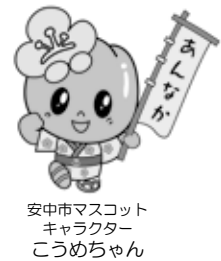
安中市マスコット キャラクター ころめちゃん