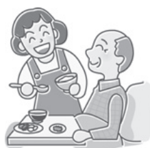
居宅サービスの場合

介護保険制度は、40～64歳の人と、65歳以上の人に納めていただく介護保険料と公費(税金)を財源に運営しています。