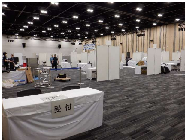
△会場入口の受付から会場を見渡した様子