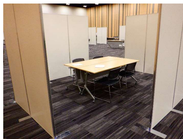
△別室に設置予定の商談スペースの様子