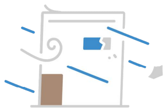
Thông tin thời tiết