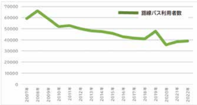
市内路線バス利用者数の推移