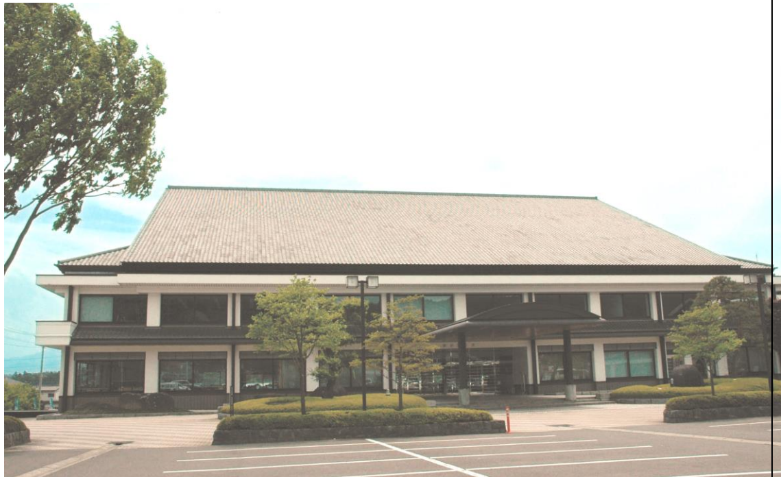
写真:安中市役所松井田庁舎

3年間の活動を通して、我々と一緒に市内の商業などの魅力を見つけさせていただきます。