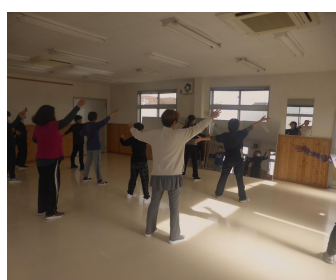
大人のダンス教室 10/25～全5回