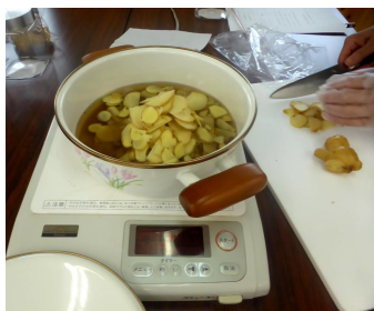
ハーブ&アロマ教室 5/10, 6/14, 7/12