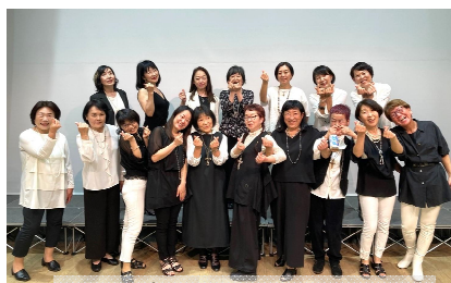
光陽「ゴスペル」の皆さん

光陽館から「光陽ゴスペルクワイヤ」がステージ発表(12:40～)に、「光陽書道会」が作品展示(9:30～)で参加します。どちらも光陽館の主催講座から始まり、自主サークルを立ち上げて活動を続けています。