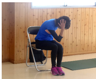
カラダ調整エクササイズ 毎月1回