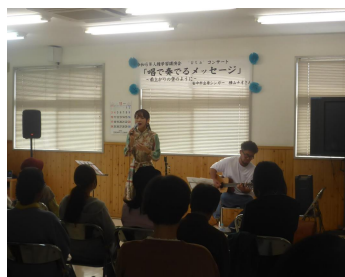
Uta コンサート 11/15