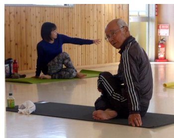
男性ヨガ教室 毎月2回