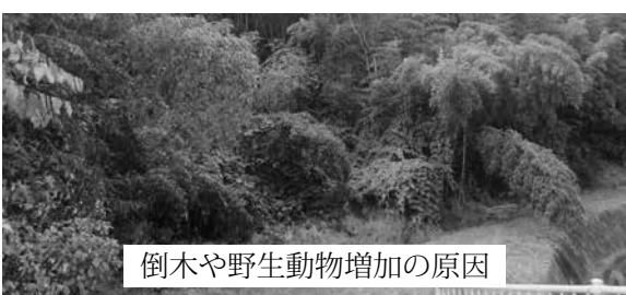
倒木や野生動物増加の原因