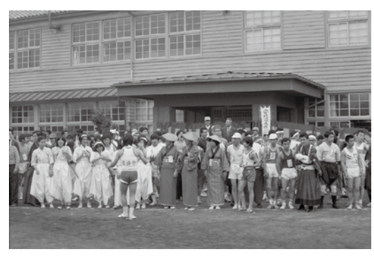
第1回安政遠足 昭和50年6月

その後、「遠足」を復活させようと、昭和50年6月に第1回安政遠足(侍マラソン)が行われました。現在では例年5月に開催され、関所・坂本コースも新設されています。当初、走者の多くは侍に扮していましたが次第に他の仮装も見られるようになり、今では仮装できるマラソン大会として有名になりました。現在、帰路はバスを利用しますが、江戸時代は自らの足で帰らなければならず、馬や駕籠を使うと厳しいお叱りを受けたそうです。