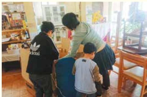
▲段ボールで家を作る親子ワークショップ

当日のサポート時間の延長については、依頼会員から提供会員のご都合をご確認いただく形になります。事前に延長する可能性があるときは、あらかじめ提供会員にご相談しておくなど、コミュニケーションをひと手間加えていただくと、円滑な相互援助活動の実施につながります。