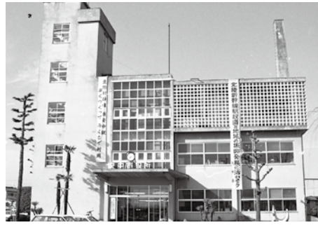
安中市役所(昭和時代)

今回は少し懐かしい庁舎の写真を紹介します。 旧安中市は、昭和30年(1955)に安中町・原市町・磯部町・板鼻町・東横野村・岩野谷村・秋間村・後閑村の4町4村が合併して「安中町」になった3年後、市制施行によって誕生しました。現在の場所に写真の市役所が建てられたのは昭和34年のことです。