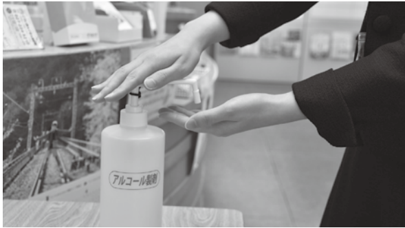
▲感染症予防のために、アルコール消毒を積極的に行いましょう。