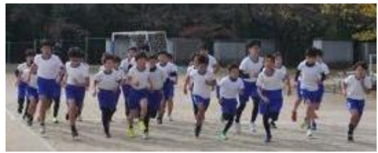
持久走大会の様子