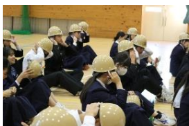
ヘルメットプロジェクトの様子

12月24日（水）～1月6日（火）まで冬休みになります。生徒は、各家庭や地域で過ごす時間が長くなります。安全・安心な冬休みを過ごせるよう地域の皆様に見守っていただくようお願いいたします。