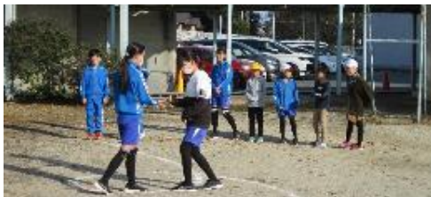
縦割り班活動の様子

穏やかな秋晴れとなった11月18日（火）に開催した校内持久走大会では、一人一人の子どもたちが精一杯走り抜くたくましい姿が見られました。1, 2年生が800m、3, 4年生が1200m、5, 6年生が1500mを走り抜きました。また、観覧された保護者の方々からも大きな声援をいただきました。子どもたちの大きな励みになったことと思います。苦しい時にこそ頑張ったこの経験を、ぜひ、今後の生活にも生かし、さらに自らの力を伸ばしてほしいと思います。