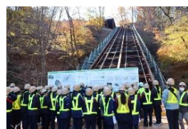
1年生工事現場見学の様子