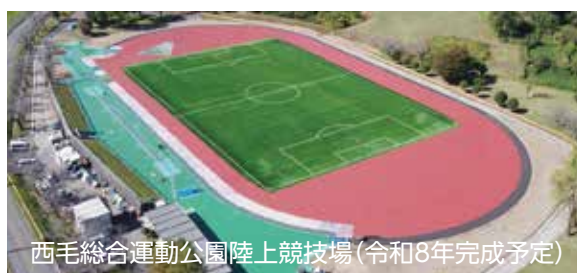
西毛総合運動公園陸上競技場(令和8年完成予定)