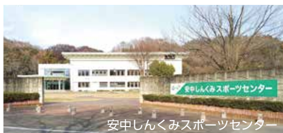
安中しんくみスポーツセンター

今回は本市出身、また市内の学校に通いながら、日ごろ厳しい練習を重ね、国スポ代表に選ばれた「スポーツで活躍する高校生」たちを紹介します。