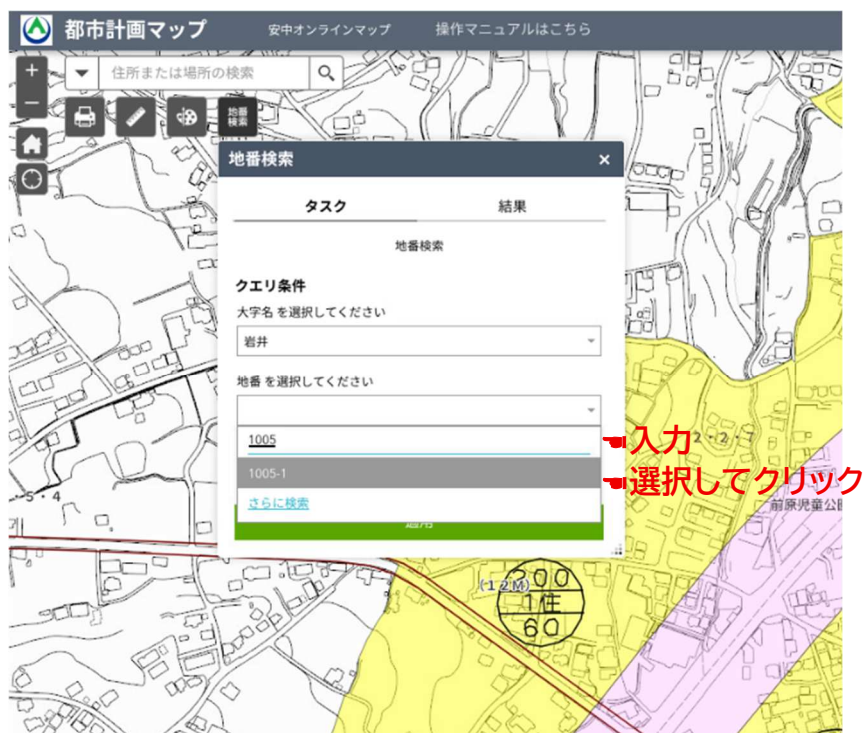
② 地番を入力し、選択