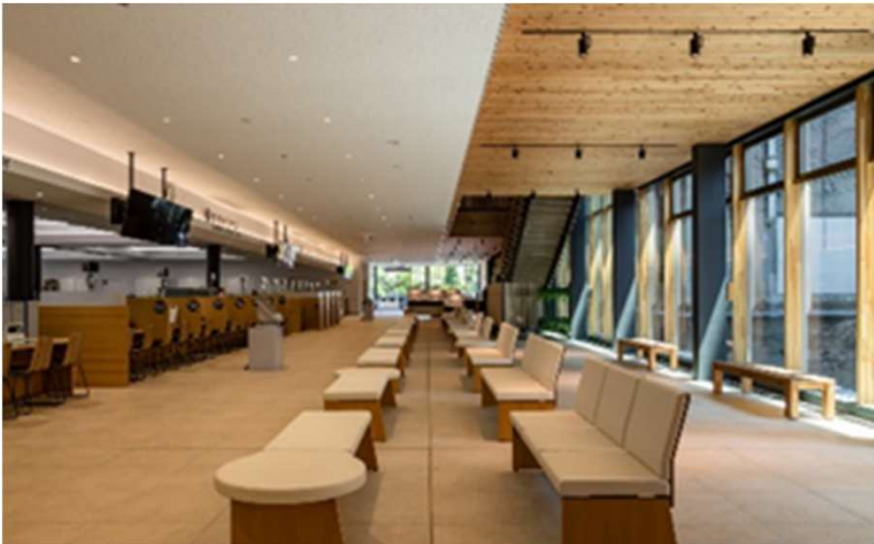
※事例：安中市新庁舎建設基本計画から転用