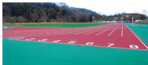
改修中の西毛総合運動公園陸上競技場

テニスコートはオムニコート※化やナイター設備の新設要望があるので聞きました。スポーツ施設の空き状況がネットで閲覧や予約ができれば、市民の利便性向上、事務効率化に繋がります。公共施設予約システムについて聞きました。