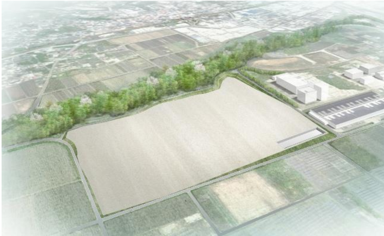
【造成イメージパース】 ※安中市作成