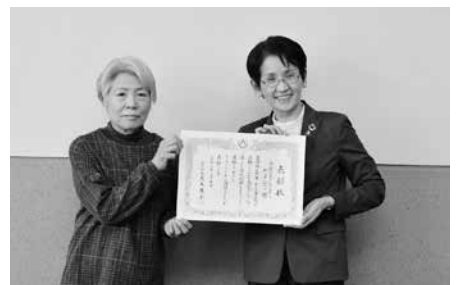
▲読み聞かせボランティアグループ やまびこ