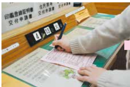
①申請書や届出書を記載

困1階市民課と国保年金課では、3月から業務別に発券機で受付し(番号札が発券)、番号案内表示パネルと音声でのご案内をはじめました。