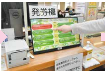
②発券機の画面パネルで希望する業務にタッチし、番号札をとる。