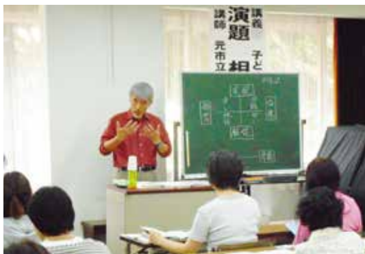
▲令和元年度の様子