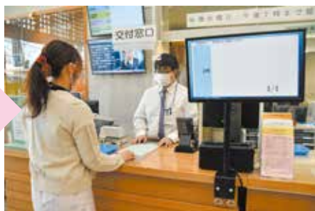
④窓口で記載した申請書を渡す

※証明書交付などは再度番号をお呼びするので、交付窓口で手数料の支払いを行い、証明書の交付を受けてください。