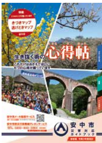
※表紙のイメージです。

市では、防災意識の向上や防災知識の普及啓発を図るため、碓氷川に係る想定最大規模の洪水浸水想定区域、新しい土砂災害警戒区域や浅間山火山ハザードマップなどを掲載した「安中市災害対応ガイドブック」を作成しました。各世帯に一冊配布しますので、災害に備えて日頃から活用ください。