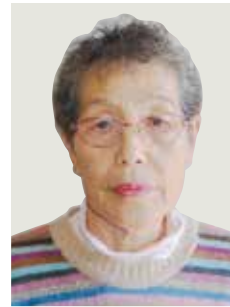
瑞宝单光章 (統計調査功劳)