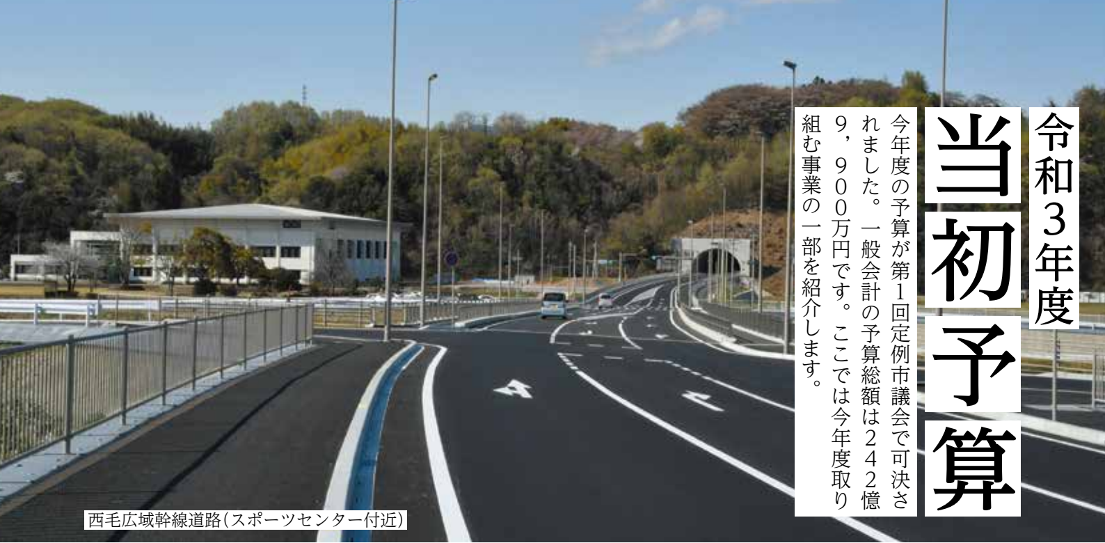
西毛広域幹線道路(スポーツセンター付近)

今年度の予算が第1回定例市議会でも可決されました。一般会計の予算総額は242億9,900万円です。ここでは今年度取り組む事業の一部を紹介します。