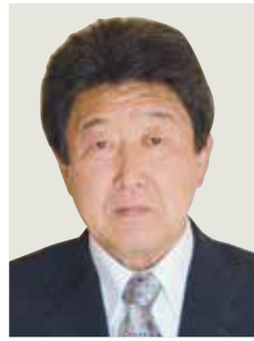
瑞宝双光章 (教育功劳)