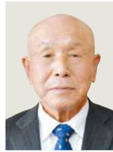
旭日单光章 (農業振興功劳)