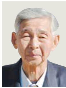
瑞宝双光章 (地方自治功劳)