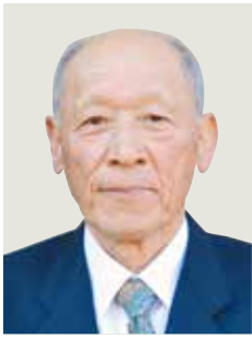
瑞宝单光章 (警察功劳)