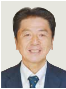
瑞宝双光章 (防衛功劳)