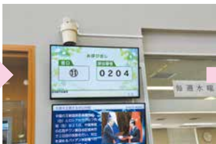
③番号が呼ばれたら該当する窓口へ