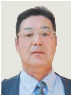
瑞宝单光章 (防衛功劳)