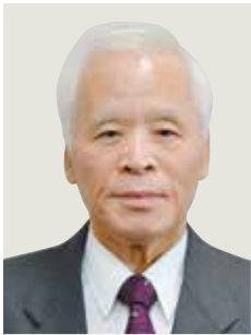
瑞宝单光章 (警察功劳)