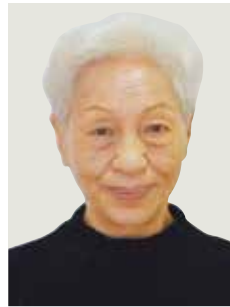
瑞宝单光章 (教育・保育功劳)