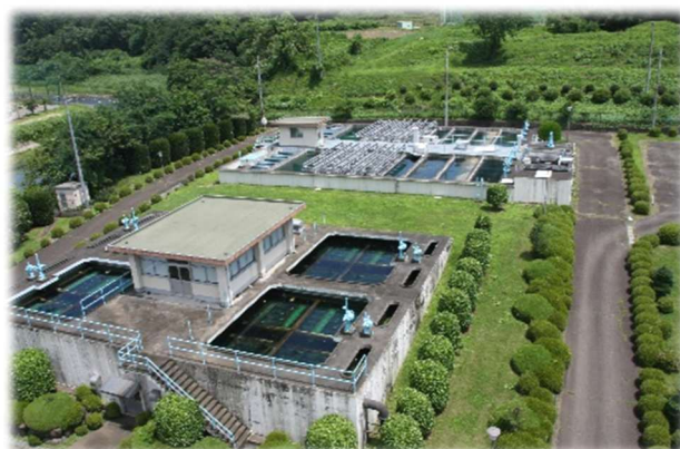
急速ろ過池（手前） と沈殿池（奥）

また、主に臭気対策のため、令和 7 (2025) 年度に粉末活性炭処理設備を設置しました。