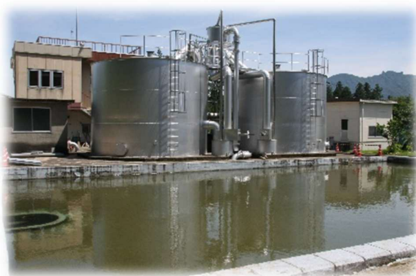
緩速ろ過池（手前）と急速ろ過機（奥）

坂本浄水場は創設事業により昭和 33 年(1958 年)に建設しました。第一水源(碓氷川)と第二水源(霧積川)を水源とし、浄水処理能力は 14,000 m 3 /日です。浄水方法は第一水源を主に緩速ろ過方式で、第二水源を主に凝集沈殿と急速ろ過方式で行っています。