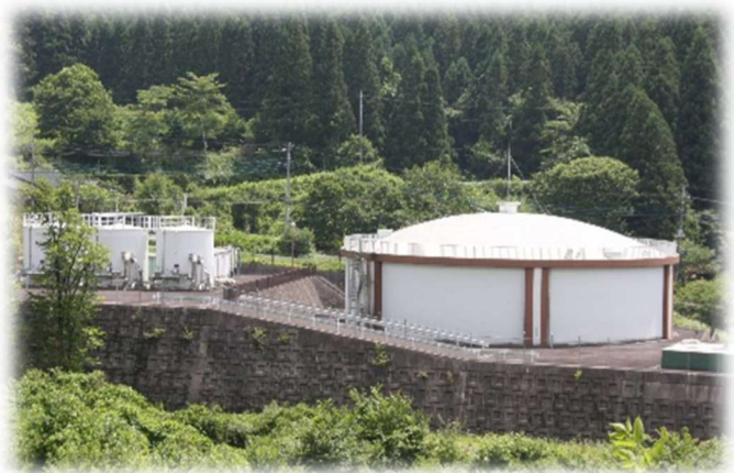
一ノ瀬配水池兼浄水池（右）と 急速ろ過機（左）

一ノ瀬浄水場は第5次拡張事業によって平成11年(1999年)に建設しました。水源は、北陸新幹線の一ノ瀬トンネルから湧出する一ノ瀬隧道湧水で、浄水処理能力は6,300 m 3 /日です。浄水方法は急速ろ過方式で行っています。