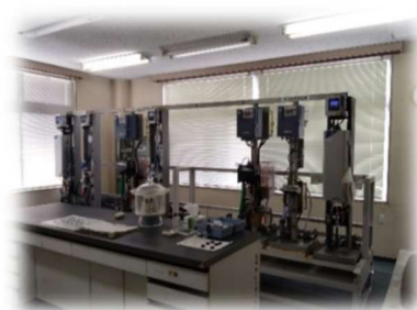
水質発信器（連続測定用水質計器）