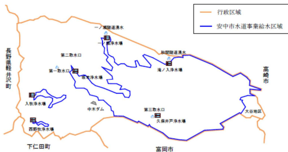
図1 安中市行政区域および安中市水道事業給水区域概略

計画給水人口は59,500人、計画一日最大給水量は44,500 m 3 /日となっています。なお、市の東部に位置する大谷地区は高崎市水道事業から給水されています。