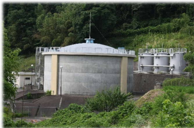
滝ノ入配水池兼浄水池（中央）と 急速ろ過機（右手奥）

滝ノ入浄水場は第5次拡張事業によって平成10年(1998年)に建設しました。水源は、北陸新幹線の秋間トンネルから湧出する秋間隧道湧水で、浄水処理能力は4,000 m 3 /日です。浄水方法は急速ろ過方式で行っています。