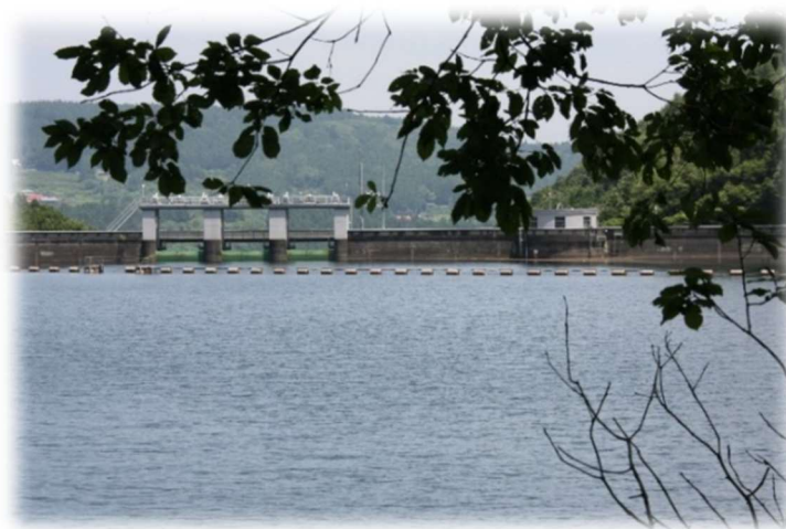
妙義湖と中木ダム

西野牧浄水場は西野牧簡易水道事業の創設によって、昭和56年（1981年）に建設しました。水源は西野牧第一、西野牧第二の2つの湧水で、浄水処理能力は48 m 3 /日です。浄水方法は膜ろ過方式で行っています。入牧浄水場と同じく簡易水道事業の浄水場として建設されましたが、現在は上水道に統合されています。