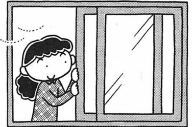
窓をあけて換気をする