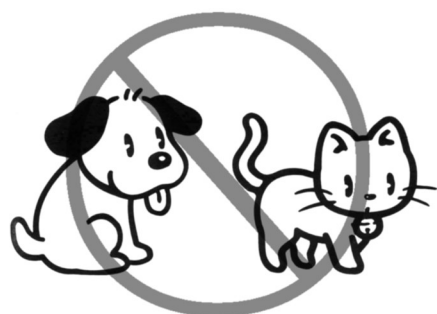
動物を飼ってはいけません