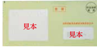
▲7月中旬ごろに封筒で郵送します