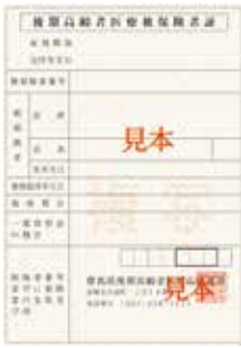
▲8月1日から新しくなります