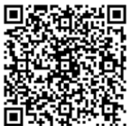
▲安中市消防団について