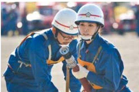
▲女性団員も活躍中