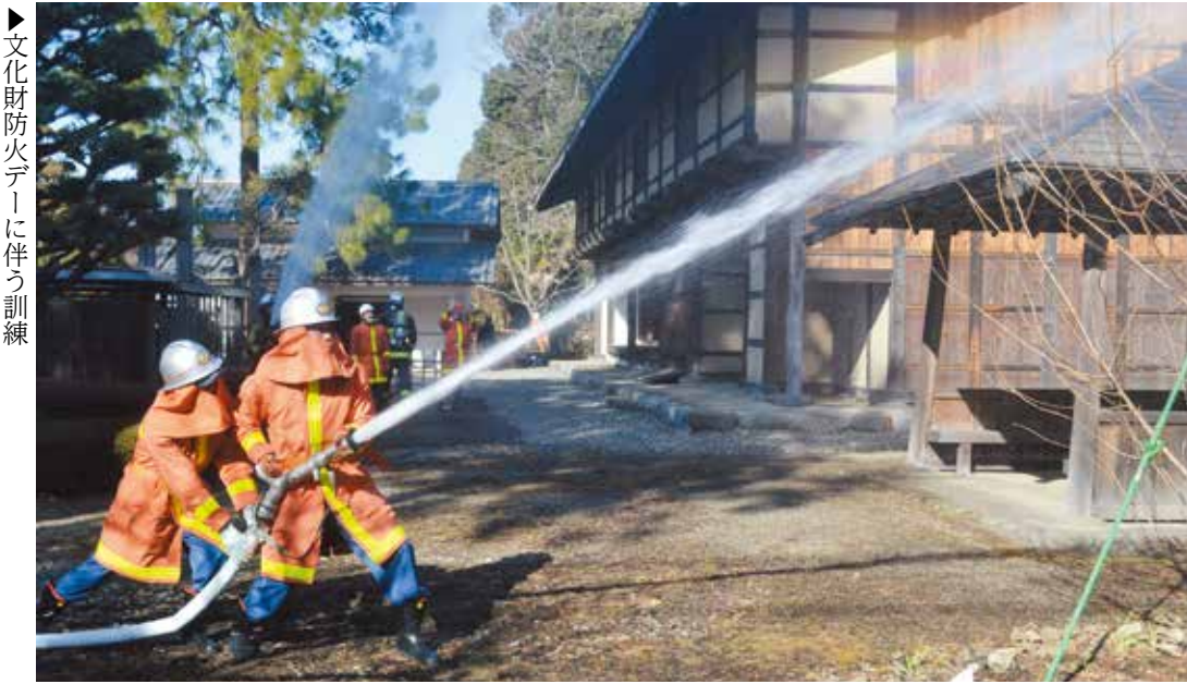
▶文化財防火デーに伴う訓練