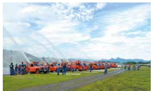
▲ポンプ運用研修会での放水訓練