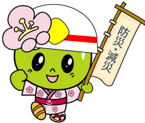
安中市マスコットキャラクター こうめちゃん