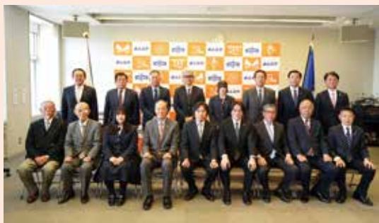
功労者表彰 受賞者の皆さん

令和7年度の安中市功労者・善行者表彰は、以下の皆さんが表彰されました。この表彰は、地方自治や社会福祉、教育文化、危険業務など各分野で長年にわたり従事し功労のあった市民、公共に大きく貢献した個人や団体などに贈られます。