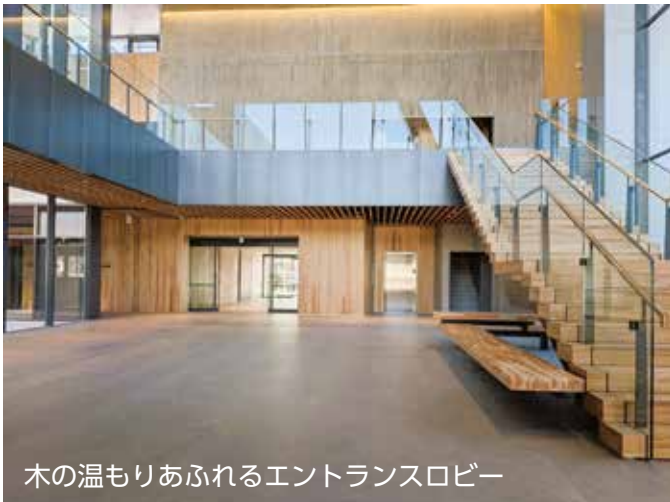
木の温もりあふれるエントランスロビー