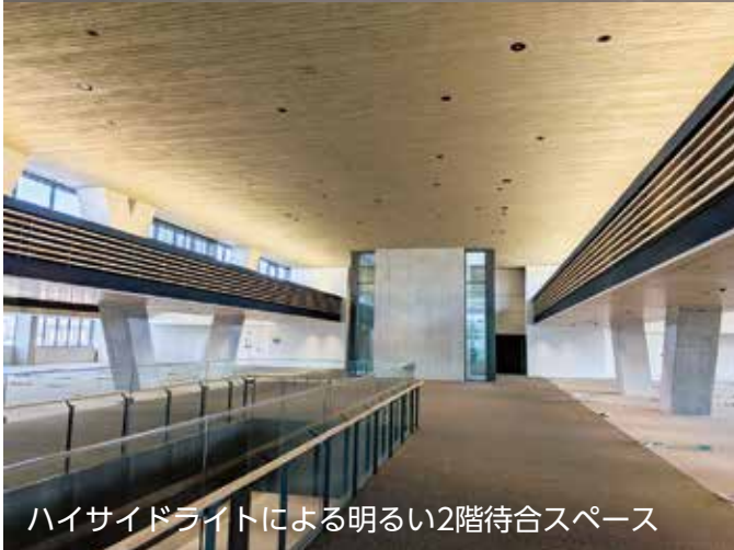
ハイサイドライトによる明るい2階待合スペース