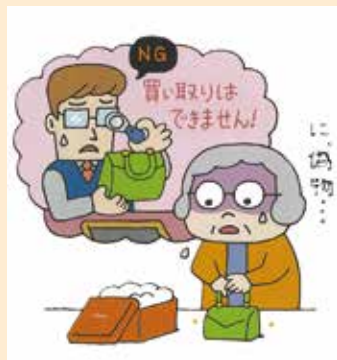
本文イラスト:黒崎 玄

バッグを手に取り、持ってみると軽く、違和感があった。質店に見せると「本物と評価できず、買い取れない」と言われ偽物だと分かった。出品者に返品・返金のメッセージを送ったが返信がない。返金してほしい。(70歳代)