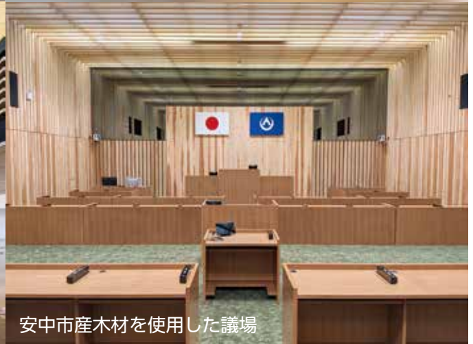
安中市産木材を使用した議場