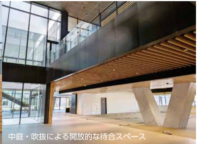
中庭・吹抜による開放的な待合スペース