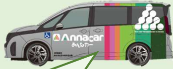
進行方向左側のドアから乗車