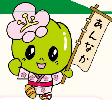
安中市のマスコットキャラクター こうめちゃん

石碑や史跡、山岳展望、山村風景等を楽しみながら誰もが歩ける魅力満載の里山です。一年を通して歩けますが新緑の春と紅葉の秋から冬の時期がお勧めです。