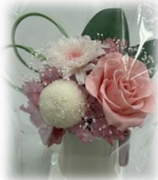
※ お見本ございます。