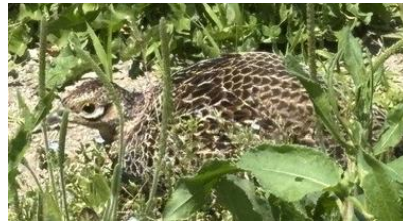
5月には、公民館の西側駐車場に、メスのキジもいました。

6月2日には、公民館の裏側で、オスのキジがアオダイショウの頭を攻撃してやっつけたものの、重くて運ぶのに難儀していました。北側駐車場に移動すると、カラスも来ましたが、どちらも重くて諦めたようです。