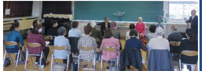
桜の花の表現を覚えた春シーズン