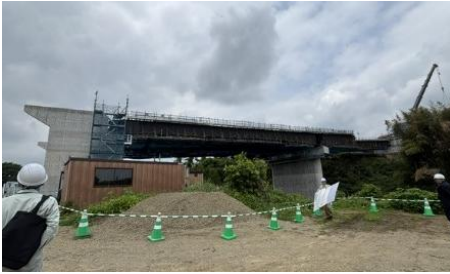
橋桁のメイン部分は設置完了

5月26日(火)10時30分、安中地区区長会では、碓氷川橋への550トクレーンによる橋桁架橋の視察をしました。施工主安中土木事務所と施工業者川田工業(株)のご厚意により、市議会建設常任委員会所属議員と一緒に視察ができました。