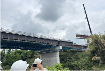
左岸側に吊り上げられる橋桁の一部