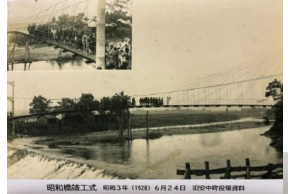
昭和橋 (上) 七曲橋 (右)