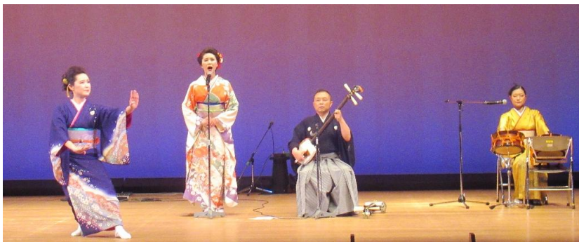
第2部のアトラクションは、紡ぎJAPANによるコンサートをお楽しみいただきました。左はうぐいす姉妹ほかの「青森民謡ショー」、右はケーナ、尺八とギターによる「竹笛の調べ」です。