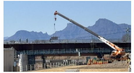
九十九川では、中宿・湯の入橋の橋桁が設置完了(2月撮影)

そこでは、つり橋の昭和橋(昭和3年完成・現所在地よりも西側)や、七曲橋(昭和6年完成)の写真が展示され、とても懐かしい風景を見ることができました。