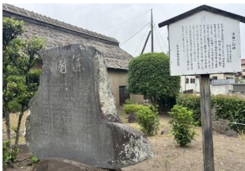
漆園の記の碑(新島襄旧宅北)