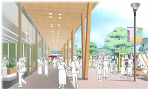
▲新駅北口駅前広場周辺のイメージ

※イラストは市民ワークショップ等で得られた皆さんの意見を参考に作成したものです。 皆さんの意向を参考に今後検討を進めていきます。