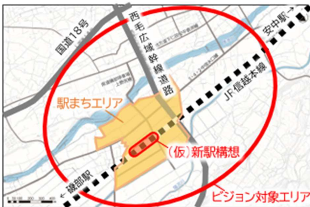
▲ビジョン対象エリア

この立地特性を最大限に生かし、既存市街地と連携しながら、新駅構想とその周辺まちづくりの方向性や将来像を示し、地域全体の魅力と価値を持続的に向上させることを目的として本ビジョンを策定しました。