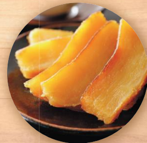
シルクスイート 干し芋 【12月~】